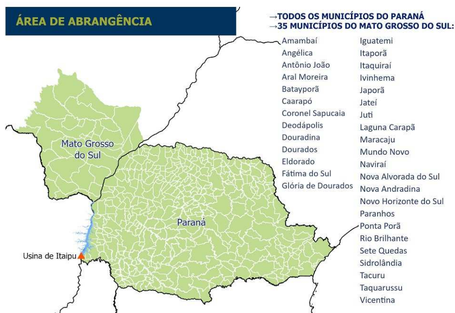
Figura 2 - Área de abrangência do edital de seleção equivale a área de atuação da ITAIPU Binacional.

Será considerada como área de abrangência/atuação os projetos que serão desenvolvidos na Área Prioritária de Abrangência da ITAIPU Binacional, conforme apresentado na Figura 2, sendo: 399 municípios do Paraná e 35 do Mato Grosso do Sul.