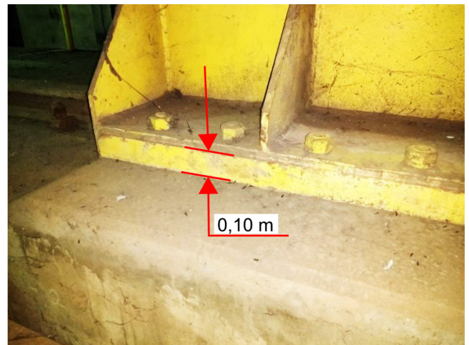
Figura 3. Detalle de fijación de la Base del fin de curso

Peso Fin de Curso: 1000 kg (aproximadamente)