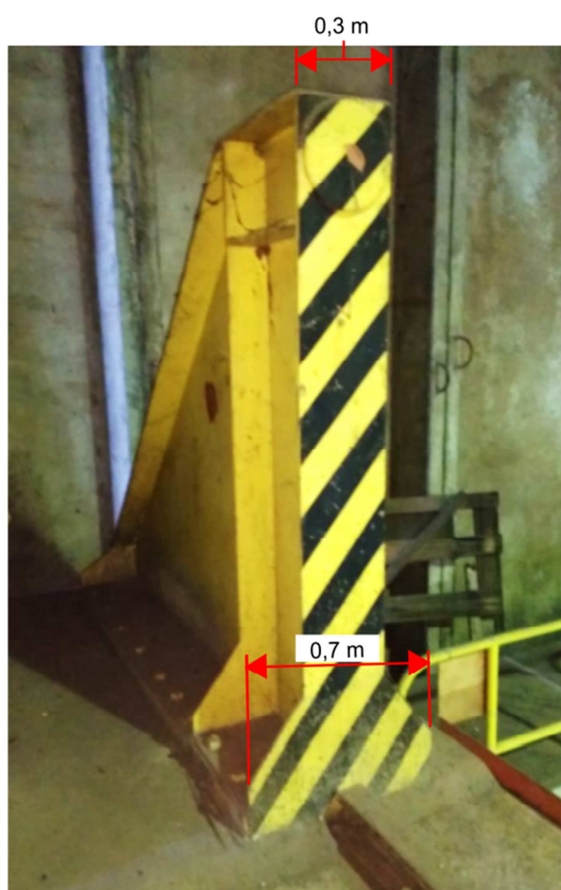
Figura 2. Vista frontal do batente