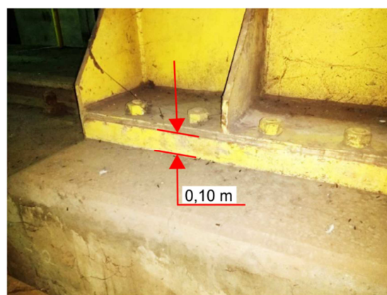
Figura 3. Detalhe de fixação da base do batente

Peso do batente: 1000 kg (aproximadamente)