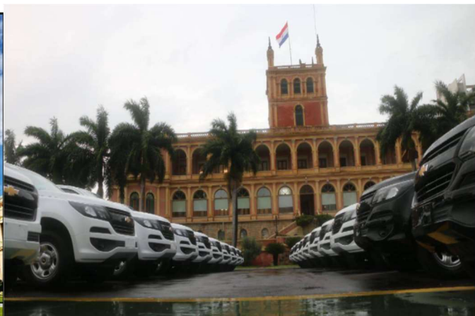
Imágenes de ilustración