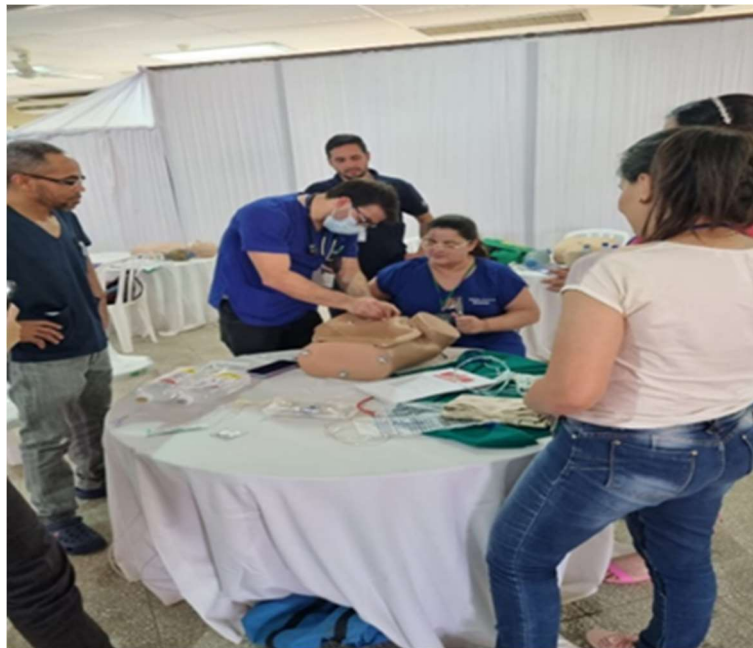
XIII Muestra Nacional de Epidemiología y IV Encuentro Nacional de Epidemiólogos de Campo.