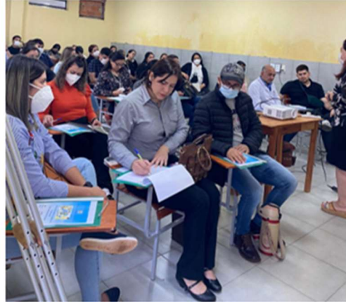
Capacitación en la herramienta Tableau