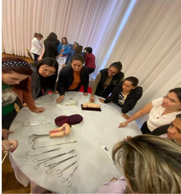
Taller Reanimación Neonatal Avanzada y atención del Recién nacido en Sala de Partos.