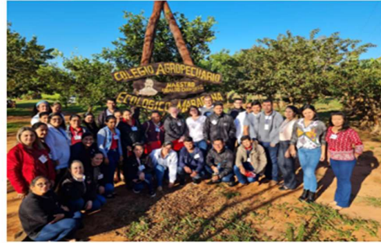
Capacitación en la estrategia de Código Rojo