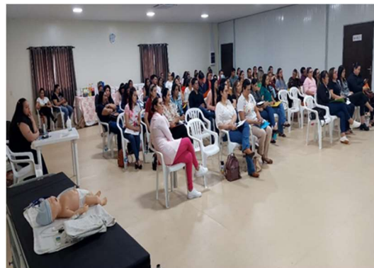
Taller de Tecnología anticonceptiva en Ciudad del Este.