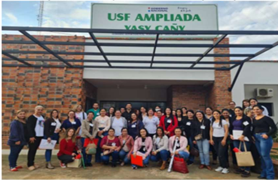
Capacitación en cuidado preconcepcional y atención prenatal en Jasy Kañy