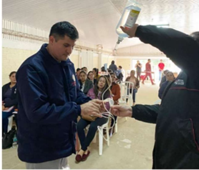
Capacitación en cuidado preconcepcional y atención prenatal en Jasy Kañy