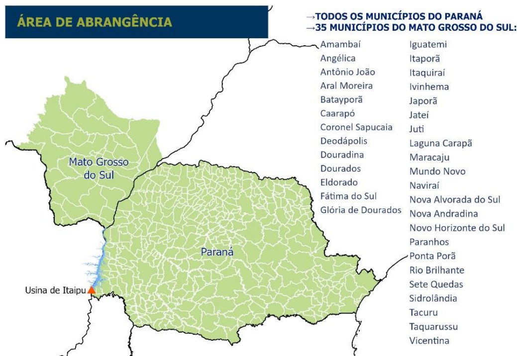
Figura 3 - Área de Abrangência da ITAIPU Binacional

A PROPONENTE deve ser da Administração Pública Municipal (Prefeitura Municipal) e pertencente a área de abrangência de ITAIPU, conforme Figura 3.