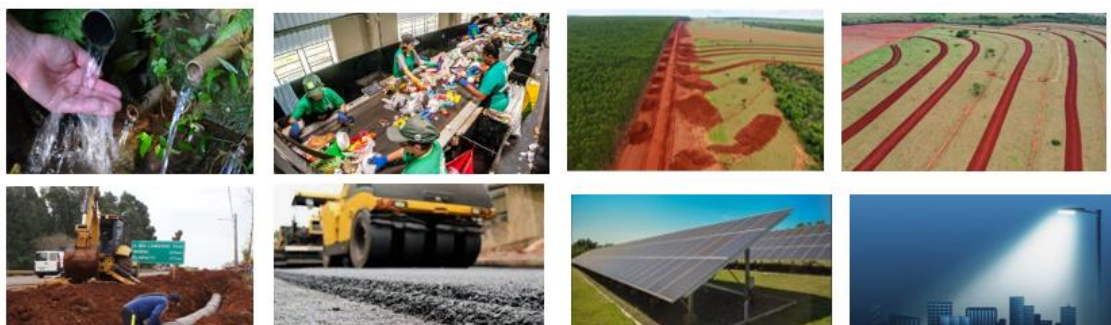
Figura 1 - Imagem ilustrativa das ações socioambientais

Nesta ação será destinado recurso financeiro de investimento para Saneamento Ambiental, Energias Renováveis, Manejo Integrado de Água e Solos e Obras Sociais, Comunitárias e de Infraestrutura, Figura 1.